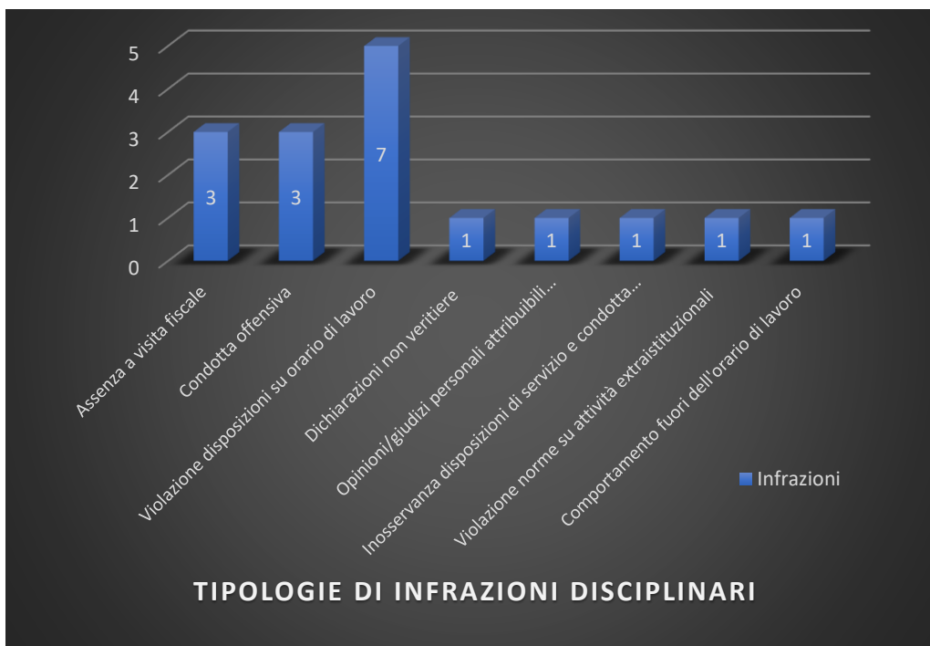
Figura 2- Numero procedimenti disciplinari avviati nel 2025, suddivisi per tipologie di infrazione

13 delle citate infrazioni costituiscono anche violazione del Codice di comportamento.